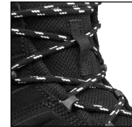
Schnürelemente mit Reflex