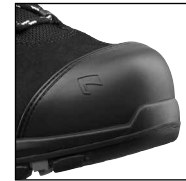
HAIX® Composite Schutzkappe