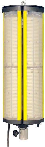
ALDEBARAN® 360 GRAD FLEX LED 960