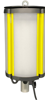
ALDEBARAN® 360 GRAD FLEX LED 600 COMPACT