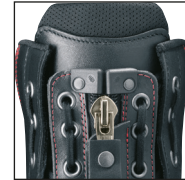
HAIX® Lacing System