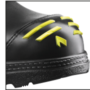
HAIX® High Durability Cap System