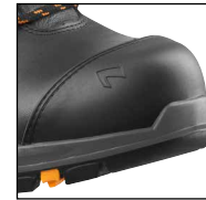
HAIX® Composite Schutzkappe