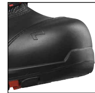
HAIX® Composite Schutzkappe