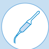
Transvaginale Ultraschallsonden (TVUS)