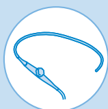
Transösophageale Ultraschallsonden (TEE)