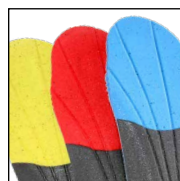
HAIX® Vario Wide Fit System