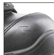
HAIX® Composite toe cap