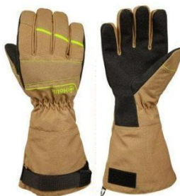
Diamond Lond Beige