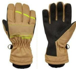
Diamond Evo Beige