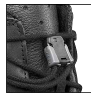
HAIX® Smart Lacing