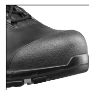
HAIX® Composite toe cap