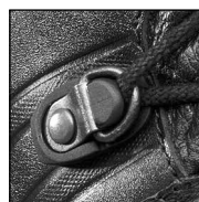
HAIX® 2-Zone Lacing